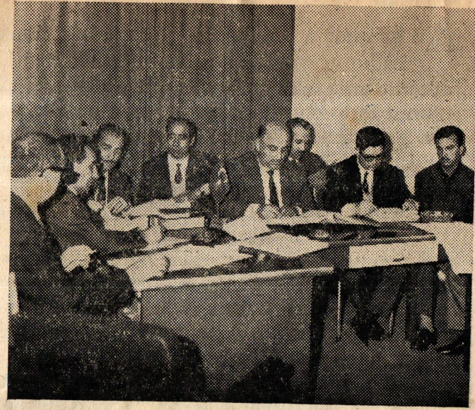
Tekstil Sendikası Temsilcileri İşverenler Sendikası Temsilcileriyle mücadele sırasında.

★ E YAYINLARI - Ankara Cad. 37/7 İSTANBUL